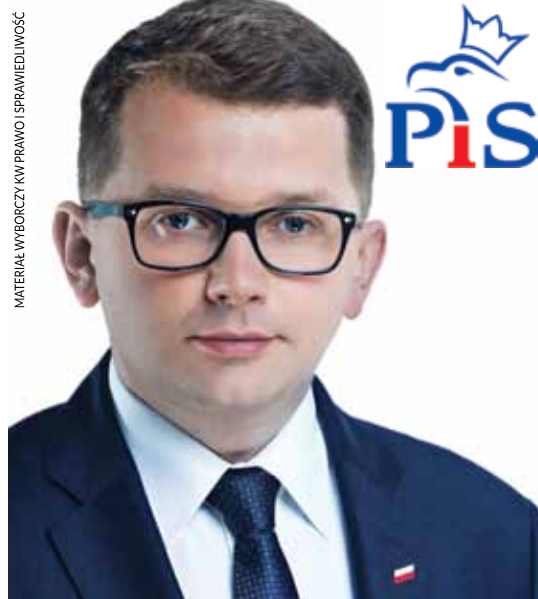
MATERIAŁ WYBORCZY KW PRAWO SPRAWIEDLIWOŚĆ

Razem chcemy, aby nasz samorząd był wreszcie dynamiczny, nowoczesny, sprawny i uczciwy. Aby nie odstawał od innych. Olkusz potrzebuje nowego otwarcia. Otwarcia na Mieszkańców i inwestorów. W ostatnich tygodniach zarówno podczas kilkudziesięciu spotkań jak i w lokalnej prasie obszernie przedstawiałem swój program. Dziś przyszedł czas podsumowania. Wierzę głęboko, że razem - bez podziałów i konfliktów - zrealizujemy nasz program. Nie służy on określonym grupom interesów, ale wszystkim Mieszkańcom. Gwarancją jego realizacji jest także mocne wsparcie rządu. Dla mnie zawsze jednak zdanie Mieszkańców Gminy Olkusz będzie najważniejsze. To im będę służył i dla Państwa pracował.